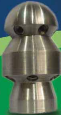
نازل دو جهته