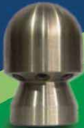
نازل تک وجهه