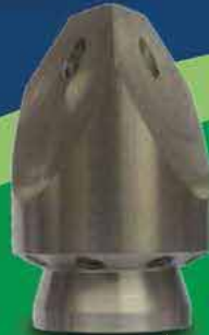
نازل سه وجهه